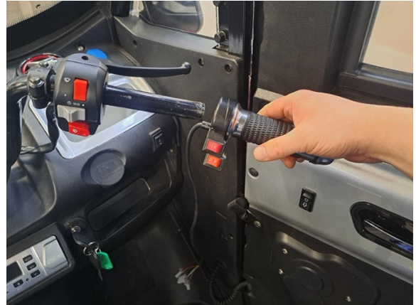
Ota kaasukahva pois.

Uuden osan asennus käänteisessä järjestyksessä.