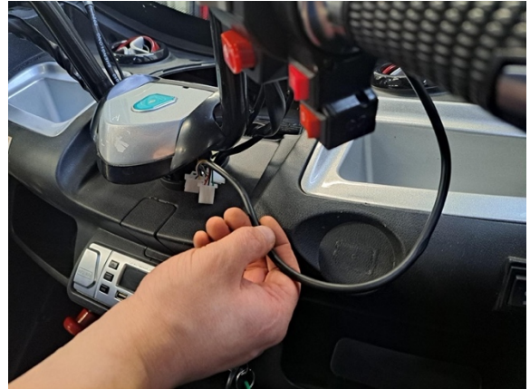
Vedä kaasukahvan johto esille.