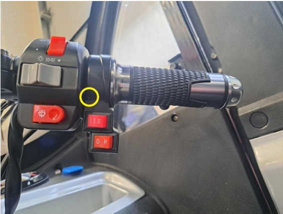
Löysää kaasukahvan kiinnitysruuvia. (kuusikoloavain 2.5 mm).