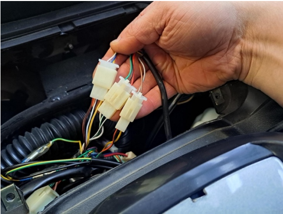
Avaa kaasukahvan liittimet.