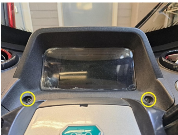
Irrota mittariston kiinnitysruuvit. (ristipäämeisseli ph2).